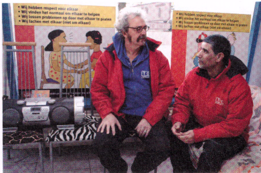
Rotterdam, jongerenwerkers van TOS, Thuis Op Straat

dame die middels een brief aan de gemeenteraad het bloembollenincident onder de aandacht had gebracht. Zij herkende zich niet in de berichtgeving, die toch op haar brief was gebaseerd. 'Ik hou van mijn wijk en wij wonen er echt met ontzettend veel plezier. Die jongens zijn best voor rede vatbaar, als ze maar echt worden aangesproken op hun gedrag.'